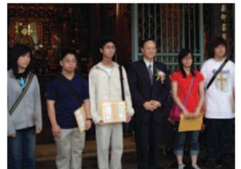
▲黃副董事長與獎學金受獎學生合影