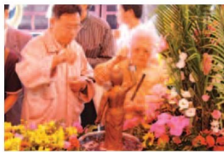
▲民眾排隊於正殿前花臺虔誠浴佛，祈求平安。

上午11點在明山法師的主持下，本寺董事長與董監事會以及各方貴賓於正殿內共同舉行誦經儀式，儀式結束之後與會來賓一一為太子佛像淋浴獻香。正殿前亦安置有三尊太子佛像供民眾行浴佛之禮，本寺同時準備以甘草、香菇煎湯煮成的浴佛水與壽桃贈與前來浴佛的民眾帶回，以求取吉祥平安。（編輯部）