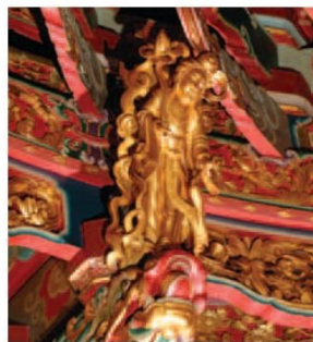
▲正殿藻井基座以八仙人物作為裝飾圖為何仙姑。