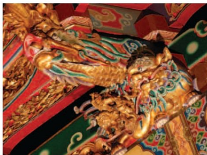
▲正殿藻井的造形基座，上為螭，下為虎。

台灣的佛寺也繼承此項傳統，藻井如同菩薩的華蓋不但豐富了天花板的裝飾，也具有宗教上莊嚴的意義。鯤鯢龍山寺在一九一九年大改築時，前殿與正殿皆採用木雕藻井，以圍成八角形或圓形的斗拱構成。這種技巧在宋代被稱為「鬥八藻井」，意思指的是用八角形斗拱所組合而成。