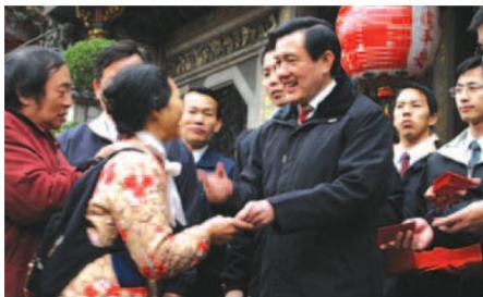
▲大年初一從總統手中接過紅包的民眾，個個笑得合不攏嘴。

大年初一的清早，龍山寺周圍早已擠得水洩不通，許多民眾排隊等著馬總統的蒞臨，八點三十分，馬總統一行人來到龍山寺正殿，向觀音佛祖持香參拜，祈求新的一年風調雨順、國泰民安，之後來到三川殿門口，向民眾致詞拜年，同時發贈新春紅包。在龍山寺董監事會及全體工作人員團拜結束、向大家互賀新春聲中，與大家共同邁向嶄新的一年。