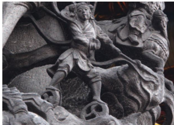
▲正殿後龍柱上雕著封神榜中的神兵神將，這尊腳踏風火輪的童子，應該不難猜出是哪位著名的神將吧？（編輯部資料照片）