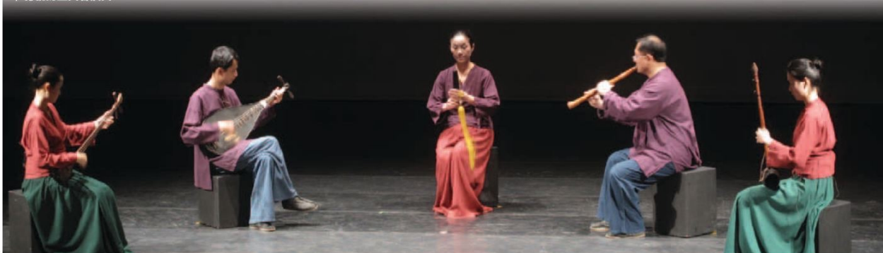
▼傳統的上四管演出

傳唱，但北管傳入臺灣後，熱鬧激昂、節奏分明的演奏方式，加上與廟會慶典活動的結合，很快在民間流行開來，南管一度面臨式微失傳的危機，幸賴保存民族傳統文化意識的提升，以及許多南管樂團持續耕耘、推廣，讓南管再度受到矚目，像一顆皎潔的夜明珠，即使身處在陰暗的角落，仍兀自發出令人無法忽視的光芒。