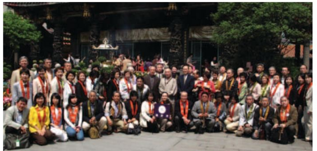
▲鎬射寺參訪團與本寺董事長、副董事長合影留念。

參訪團的團員特別進入正殿參拜，先朝主神觀世音菩薩行三鞠躬禮後，齊聲念誦般若波羅蜜多心經等經文，一時間，正殿內充滿朗朗的誦經聲，氣氛莊嚴肅穆，之後團員在寺內各處參觀，雖然在龍山寺僅短短停留不到一個小時的時間，但無論是歷史悠久的建築、向觀音問事抽籤或是月老前求姻緣紅線，相信這些異國的宗教文化都在參訪團員心中留下既新鮮又深刻的印象。