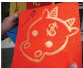
▲小朋友親筆畫出可愛的小金牛，童真的畫風令人愛不釋手。

1月13日一早，龍山寺板橋文化廣場的同仁便開始佈置，除了散發著香味的紅紙與筆墨，我們還多準備了金彩墨汁，讓代表富貴的金色與象徵喜氣的紅色相襯之下更添年味。翻翻印刷好的樣張，看看現場供挑選的字帖，大家都想挑選一副最合適的春聯，讓家中更添濃濃的年味。