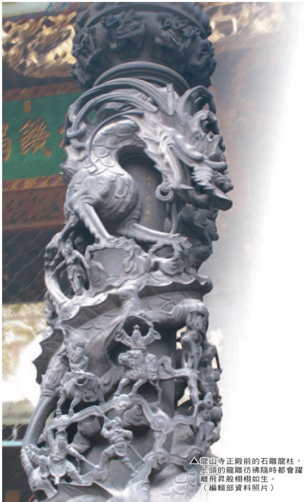
▲龍山寺正殿前的石雕龍柱，上頭的龍雕彷彿隨時都會躍離飛昇般栩栩如生。