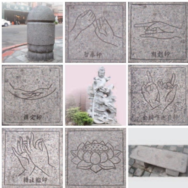
▲仔細留意，佛具街的人行道上不時會出現充滿佛教教義的蓮花或手印圖案，連行道樹都特別選用羅漢松，這些細節均表現出佛具街的特色。

位於龍山寺旁有條北臺灣有名的佛具街，佛具街並不是真正的路名，而是指西園路自桂林路到廣州街之間的路段，短短幾百公尺就有約一、二十間佛具店在此營業。最初因為龍山寺的興建，佛具雕刻師傅紛紛在此聚集，隨著龍山寺的香火鼎盛，漸漸帶動佛具店一間間的出現，進而形成充滿特色的佛具街。