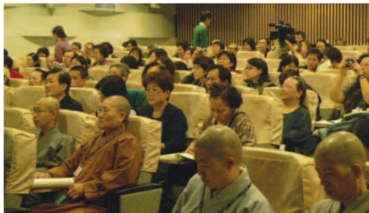
▲ 佛教藝術營學員不但有出家師父，更不乏對佛教藝術經典有興趣的朋友們。

人的感動。本次研習營共有250名學員踴躍報名參加，藉著資料豐富的研習講義與現場投影片放映，搭配講師生動精彩的解說，讓與會者在這三天留下深刻的印象，帶回寶貴的學習經驗。（編輯部）