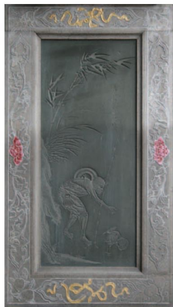
▲龍山寺前殿龍門入口處的石雕，以「水磨沉花」的手法雕成，說的是成語「鵝蚌相爭，漁翁得利」的故事。

臺北龍山寺的石雕，在西元1919年大修時，從福建泉州惠安請來一群實力堅強的石匠師，他們展現最高的工藝技術，在臺灣留下來這批精美絕倫的作品，值得我們細加品嚐。