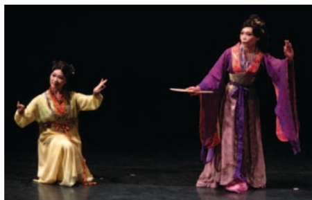
▲南管戲曲中人物扮相秀氣，一舉手一投足都帶著無限的韻味。

南管戲曲受到宋元時期傳奇與雜劇的影響，內容多描述才子佳人的故事，透過文雅的唱詞、細膩的身段，含蓄婉約的將浪漫的爱情故事表現出來，頗耐人尋味。曾經南管的劇樂在臺灣各地