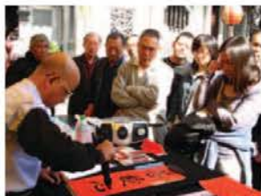
▲龍山寺廣場前，被書勁有力的字體所吸引的民眾圍著觀看老師懸腕揮毫。