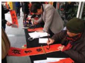
▲現場揮毫的書法老師們姿勢或坐或站，字體各有千秋。

1月18日在龍山寺舉辦的春聯贈送活動更是人潮滿滿，現場揮毫的書法名師，字體各有不同，甚至將書法結合圖畫將過年的吉祥話展現出來，令人驚嘆！廣場前排得長長的人龍，即使準備再多的紅紙，還是供不應求。今年您是否也在門上貼了我們精心準備的春聯呢？別忘了明年除舊佈新時，再來與我們結緣囉！（編輯部）