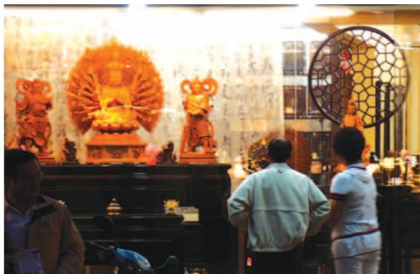
▲夜晚的龍山寺香客不減，佛具街上的行人也絡繹不絕，在燈光照射下，許多人都會被佛具店櫺窗中莊嚴精美的佛像吸引，佇足欣賞。

望著望著，馬路上的人車嘈雜聲像是突然遠離了一樣，心情瞬間安靜沉澱下來，雖然處在市區中，卻彷彿找到一個寧靜的角落，可以停駐休息、蓄積能量。數百千年來，多少佛像被雕刻、祭拜，庇佑著千千萬萬的人們，萬華佛具街只是這數百千年來的一小部分，卻也寫下北臺灣佛具興盛的一段歷程，而且還在繼續下去。（文、攝影/高則容）