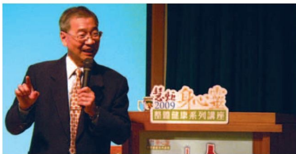
▲ 鄭教授妙語如珠，以生活化的舉例說明如何建立良好人際關係。

成功，如果我們與人相處時能考慮到這三種需要並適時給予滿足，就能建立良好人際關係，拉近與人之間的距離。