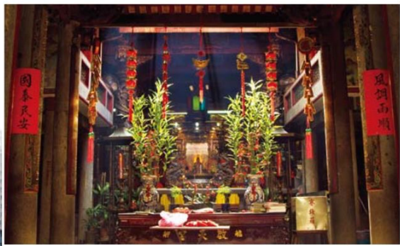
▲啟天宮原本的樣貌是土塊編竹的茅草民房，民國三十年時以磚瓦興修，定名為啟天宮，現在的樣貌為民國七十九年後確立的。