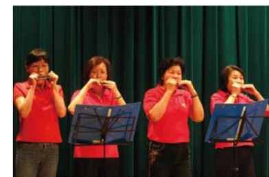
▲口琴班合奏出悠揚的樂曲。

本屆動態成果發表會的節目多達28個，活動自下午一點半開始直到五點，三個半小時的演出，靜態與動態演出穿插呈現，緊湊的活動安排與串場，讓觀眾的目光始終停留在舞台上，歡笑聲與掌聲始終未曾停歇，這場結合舞蹈、音樂、武術、詩詞吟唱的午後盛會，學員展現出平日認真上課、努力練習的成果，也讓在場的來賓以及親友們得以了解，文化廣場課程的多元性與講師們教學的成績。