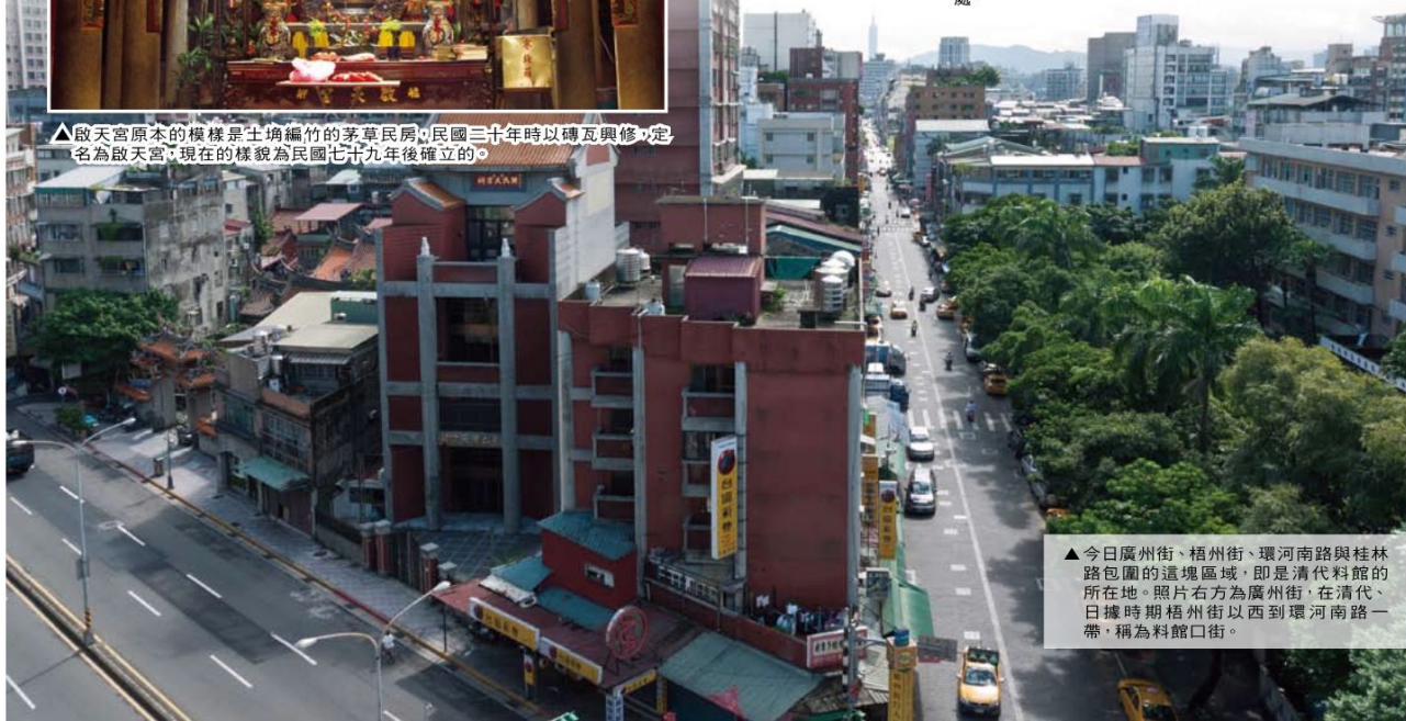
▲今日廣州街、梧州街、環河南路與桂林路包圍的這塊區域，即是清代料館的所在地。照片右方為廣州街，在清代、日據時期梧州街以西到環河南路一帶，稱為料館口街。