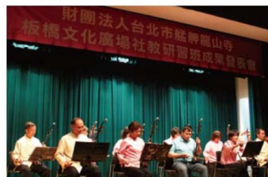
▲二胡班的學員表達出樂曲的奔放與激昂。