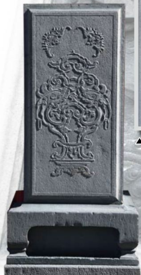
▲後殿牆堵「螭虎圍爐」石雕圖案，施以「壓地隱起」手法雕琢。