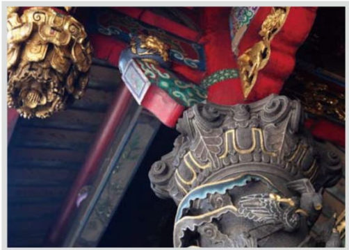
▲前殿後步柱的一對花鳥柱，柱頭採西洋建築科林斯柱式，圓雕技法雕刻。

龍山寺整體建築以石雕最為傑出，題材包括歷史典故、神話、戲曲、清供圖、柳塘情趣及花卉翎毛等，走過花瓶式石欄杆圍成的大殿迴廊，即置身於滿壁石雕的牆堵，有出自名家手筆的詩文聯對及圖畫，運刀如筆，古拙有力，清奇恣肆有之。（本文作者為文史工作者，研究臺灣古建築近三十年，現任龍山寺板橋文化廣場臺灣傳統藝術講座授課講師）