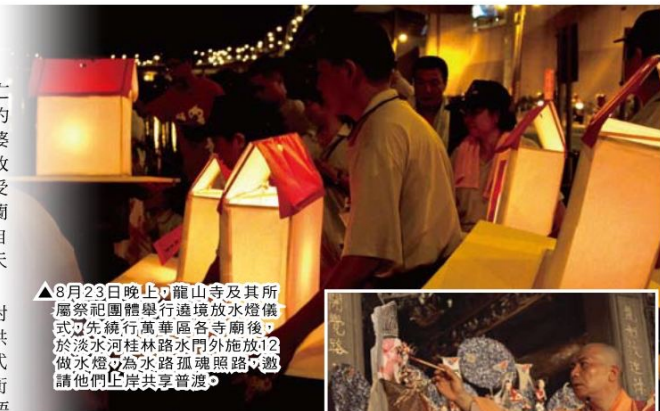
▲8月23日晚上，龍山寺及其所屬祭祀團體舉行遶境放水燈儀式，先繞行萬華區各寺廟後，於淡水河桂林路水門外施放120盞水燈，為水路孤魂照路，邀請他們上岸共享普渡。

據說南朝梁武帝時中國始有盂蘭盆會，結合了佛道後，救度的對象，從原本的普施人間，轉變為普度餓鬼。宋代以前著重在供佛、供僧，以報父母、祖先恩德；宋代以後，開始改用焚燒冥紙、衣服的方式追薦祖先。臺灣開發史中經歷過無數次的苦難，災難、械鬥與漢番衝突，對於逝去者的懷念與恐懼，轉化成對於中元普度的重視。臺灣諺語「七月無閒和尚」，即是指整個七月各地都有許多法會，和尚、道士不得閒暇。隨著政府宣導節約，以及社會型態的改變，往昔熱鬧的普度氣氛，今日只剩下少數地方看得到了。（編輯部 / 張詠維）