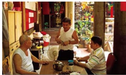
▲啟天宮的信徒以鄰近的居民為主，鮮少有遊客、外地信眾前來，清幽的環境，是這一帶長輩茶常的好去處。