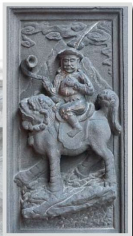
▲媽祖殿側牆石雕