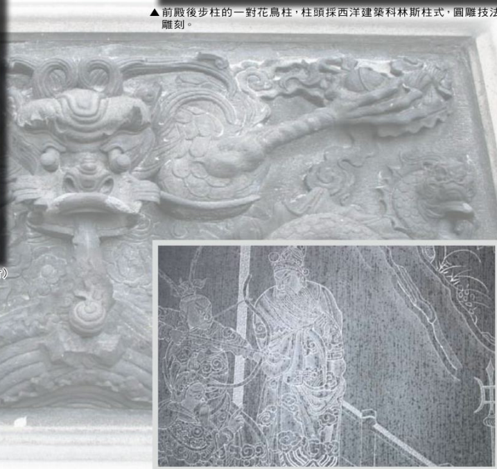
▲以「水磨沉花」陰刻手法雕琢之三國人物故事「轅門射戟」。