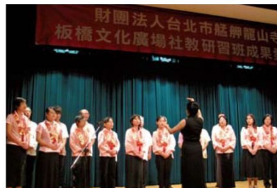
▲詩詞賞析班以古韻吟誦雋永的詩句。