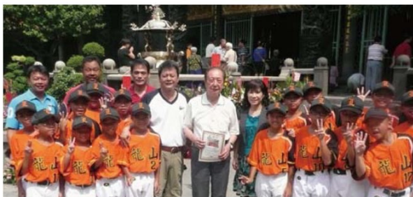
▲黝黑的皮膚，充滿活力的笑容，也許下一個發光發熱的臺灣之光，就在這群龍山國小少棒隊的小朋友之中。

民國93年為重現光榮傳統，排除萬難後重新成立，6年來已取得多次冠軍，現為臺北市6所重點培訓國小少棒隊之一。（編輯部 / 張詠維）