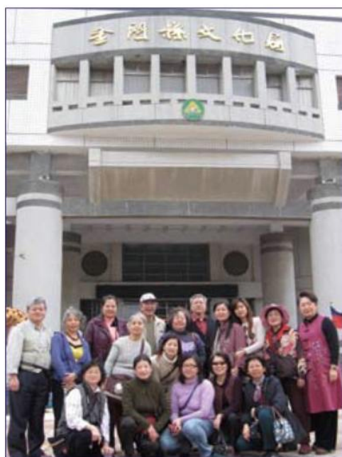
▲ 本廣場佛畫班為了此次展出，學員們也一同前往金門並於文化局前合影留念。