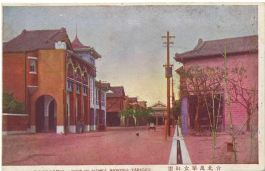
▲ 萬華女紅場落成於大正11年(西元1922年)。教導女子學習紡織、裁縫及刺繡等工作。

金紙廠因工作而認識，進而戀愛結婚，在那個還穿著木屐的年代，夜裡約會結束返家時，兩人還把木屐拿在手上，光腳走路，就是為了怕被人聽到腳步聲。