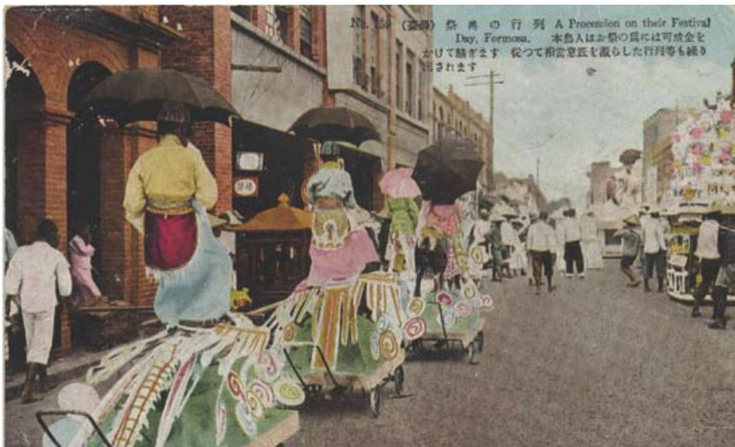
▲ 即是臺灣民俗慶典的「遊行花車」，由於人物化妝巧扮，佈置出富含詩意的情景，因此又稱「詩意閣」。多由商家出錢贊助，因此也有廣告意味，如茶商的「敲冰煮茗」、酒樓的「太白醉酒」等。詩意閣上的人物，不少是由大稻埕的「藝姐」來裝扮，吸引許多人遠道來參觀，當時流傳「未看見藝姐，免講大稻埕」的說法。