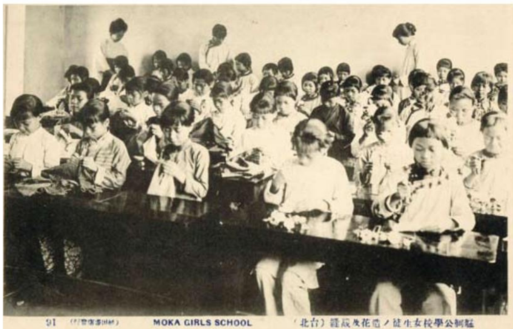
▲ 艋舺公學校創立於1896年，1907年遷至今萬華區桂林路，建造木結構校舍，1920年代末期再以鋼筋水泥重建。1922年改名為老松公學校，戰後改稱老松國小。照片中為女學生在學習裁縫。

今日的中山女中，前身是臺北州立第三高等女學校，成立於西元1897年，坐落於今日內江街臺北護理健康大學，是當時臺灣女性能就讀的最高學府，課程偏重技藝教育，符合各地公學校教師的需求，因此畢業生都為各地公學校爭相聘用，可說是日本時代臺灣女性教師