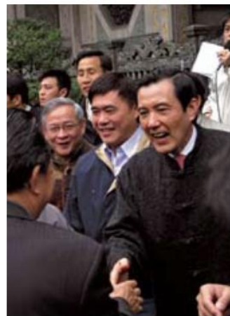
▲ 總統於本寺三川殿前發送新春紅包，並與民眾握手互賀新年。

是對應生肖、時節的電動花燈，更是吸引民眾前來觀賞的特色之一。一般人聽到太歲，常以為那是不吉的象徵，其實太歲是守護神，所以與太歲相沖才稱之為「犯太歲」，進而有所謂「安太歲」的習俗。在龍山寺左側的太歲廳供奉著值年太歲，並在元宵節當天同時舉行安奉值年太歲星君典禮，祈求值年太歲守護一整年平平安安，無災無殃。