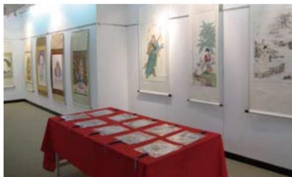
▲ 在金門的佛畫展覽上，學員們的作品不但有莊嚴的掛軸佛像，也有融合藝術於生活的工筆畫扇。

金門，第一印象是「前線」，如天王力士般守護著台灣，十分感恩因為有金門，台灣才能有平安富裕的生活，1992年金門開放後，始能一窺面貌，舉目所見植林有成，自然生態環境得天獨厚，鳥類四處可見，設施規畫井然有序，眾多的宗祠、廟、洋樓，在其中可發現金門人的淳樸感恩與飲水思源，閩式的建築古厝有燕尾式的翹脊與馬背式的圓脊令人驚艷，處處有牌匾、對聯，