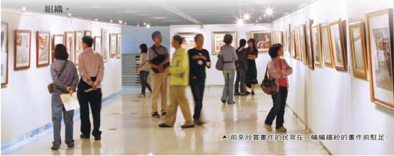
▲ 前來欣賞畫作的民眾在一幅幅繽紛的畫作前駐足。

台灣粉彩教師協會本著推廣與交流的精神，於今年4月12日起，於台北市艋舺龍山寺板橋文化廣場舉辦會員聯展，展場中有將近百幅粉彩作品同時展出。開幕時間為4月16日（星期六）下午3：00，並於開幕儀式後安排粉彩專家進行一場精彩的研習活動，吸引許多喜好粉彩藝術的朋友前往參觀。