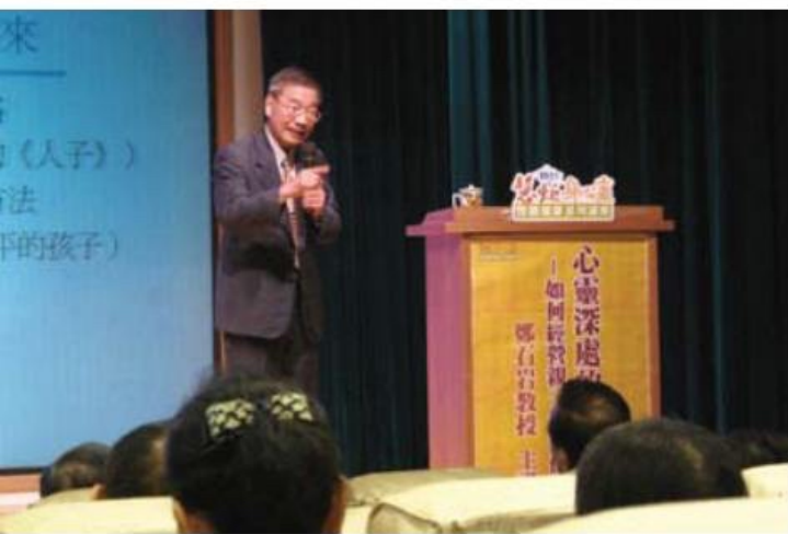
▲ 鄭教授全場妙語如珠，讓整個下午演說毫無冷場。

無 論是身為父母親，或是已經升格當了阿公、阿嬤，您是否為了孩子的教育而苦惱？除了在學習上能獲得佳績之外，如何讓孩子從小就培養健全的人格與良好的品德，是許多家長所關注的重點之一，然而因為教育問題，常常造成親子關係出現阻礙或是疏離，要怎麼經營好親子之間的關係，讓家庭氣氛和樂？這一次，龍山寺板橋文化廣場與台北慧炬雜誌社合作，邀請到教育心理專家鄭石岩教授，在星期六的下午，帶來溫馨且實用的經驗分享。