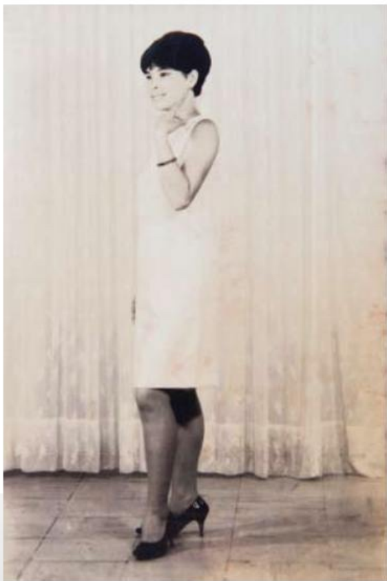
▲ 1970年代的沙龍照。

在我們的母親、外婆的年代，女性受到社會上重男輕女，女子不需要讀太多書的觀念影響，生活的重心只在家庭、丈夫、小孩上，而自己的人生，卻隱沒在時間長河裡。今天的女性，生活的重心依舊圍繞著家庭，卻已懂得給自己一些空間，享受人生的滋味，享受生命的喜悅。她們是我們的母親、姊妹、以及最愛的另一半。謝謝時代的進步，謝謝社會的轉變，讓我們最愛的她，能夠在快樂與歡笑中，度過每一天。