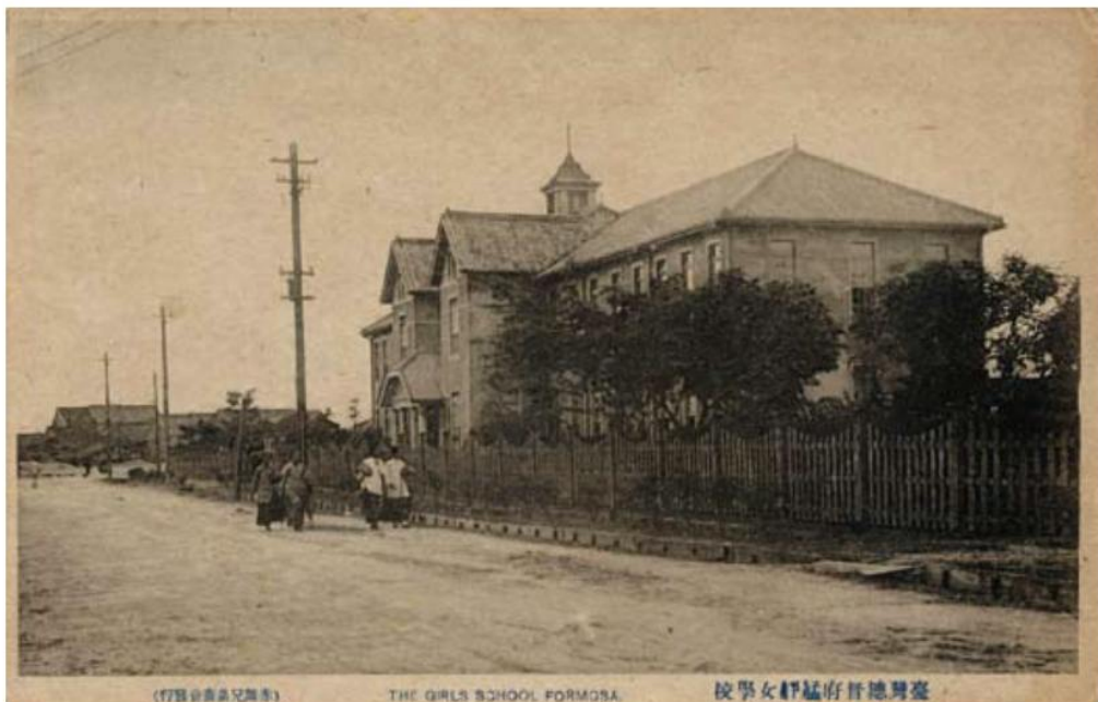
▲ 臺北第三高女為今臺北市立中山女中，為臺灣最早的女中，1898年初創於士林，1911年遷校於艋舺，即今內江街國立臺北護理健康大學。至1938年遷至今長安東路現址，明信片為艋舺校舍。

的搖籃。當時的臺北第三高女是一所本島女性占三分之二的名校，要擠進該校的窄門相當不容易。入學者多半是千金小姐，在經過教育後，都成了社會上的菁英階層，因此迎娶該校畢業生的聘金非常高，歷史學家連橫說聘金高達三千元，是一般公學校畢業生的6倍，如果又當了老師，那又要再翻上一倍了。第三高女畢業的校友中，以後來成為國大代表的謝娥，前總統李登輝的夫人曾文惠，還有臺灣首位貴族院議員許丙的太太等最為有名。