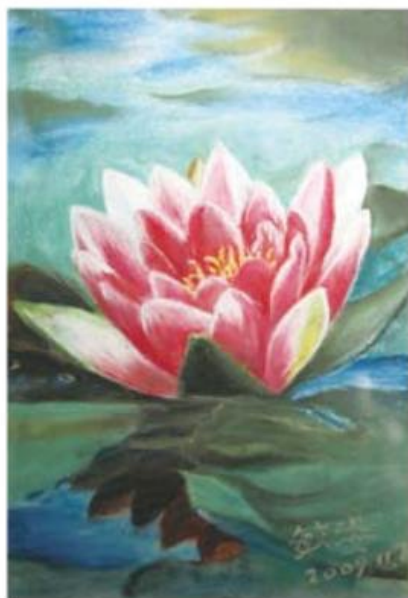
▲ 粉彩教師協會會員畫作。

近四十年來，歐美國家粉彩畫蓬勃發展，有鑑於國內粉彩畫發展遠不及歐美國家，在國立藝術教育館、旅美知名畫家張哲雄教授、及許多喜好粉彩藝術教師的推動下，台灣粉彩教師協會於99年2月由內政部函准設立，成為國內以推動粉彩藝術教育、展示粉彩創作成果、重視粉彩藝術的學術研究，並與國際粉彩藝術組織建立交流關係為宗旨的合法組織。