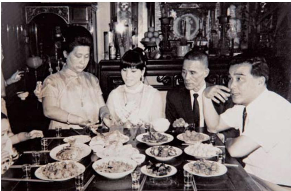
▲ 1970年代的結婚習俗。新娘出嫁當天，在祭拜祖先後，會與父母、兄、弟、姊、妹等共食十二道菜餚，稱為「食姊妹桌」。參加人員宜為單數，加上新娘恰好成為雙數。

時至今日，男女平權的觀念相當普及，但在多數的父母心中，對於男女生間仍有很大的不同，男生至少得讀完大