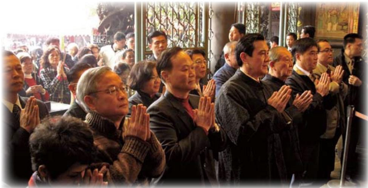
▲ 馬英九總統與眾人一同在正殿向菩薩合十行禮，共同為國家、人民祈福。

川殿廣場致詞賀年，身為萬華長大的孩子，馬總統還準備了有獎徵答與民同樂，為了能從總統手中得到民國100年的紀念紅包，每個人莫不卯足了勁地舉手搶答，隨後由馬英九總統、董事長黃欽山先生及張雪玲組長現場發送紅包。十一點在正殿舉行新春團拜典禮，本寺的董監事齊聚一堂互相道賀新春，共同祈福，願新的一年社會祥和、生活平安和樂。