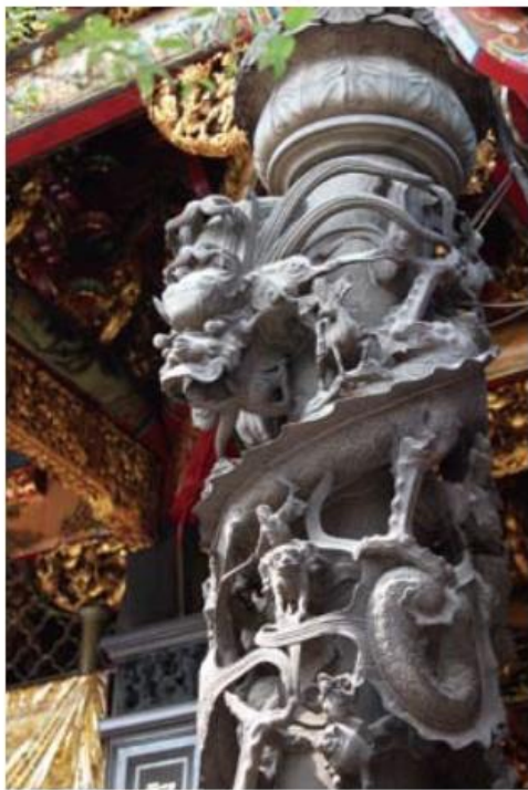
▲ 正殿前的龍柱除了有蟠龍繞柱，更有其他傳說瑞獸。

鞋的步行者、有與山僧閒話禪機者、路旁聊天者、脫下斗笠敞開胸襟小憩者，有享受清風吹拂者，有張口長嘯者、有塘邊觀賞採蓮者……情態種種不一而足，更有撓背、掏耳、挖鼻、搓腳……，神情生動，輕鬆有趣，為龍山寺中頗具特色之石柱。