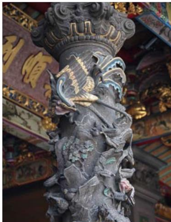
▲ 三川殿後的花鳥柱，其雀鳥展翅回首的姿態栩栩如生。

在後殿前，人物柱名「郊遊記趣圖」，為「武榮媽祖會」「甲子年(1924)」所捐獻，惠安石匠所雕作。其用鑿如筆，恍如圖畫，沿途風光明媚，重巒疊嶂，奇岩佳樹，鳥語花香，遊人如織；有馬上觀景童子相隨者、有歇畢欲上馬者、有蹲下繫