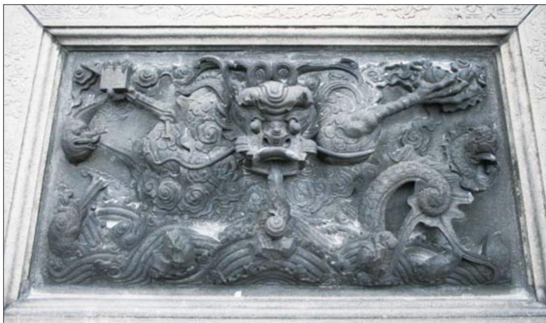
▲ 位於龍山寺正殿月臺前的雲龍御路，一爪握印、一爪抓珠，氣派十足

沒有人見過真正的龍，但是卻留下許多龍的傳說，信仰的傳承灌溉著文化與藝術的苗圃，有關龍的傳說與經典，還有許多許多，只期盼藉著這簡短的介紹，能讓您在下一次進入艋舺龍山寺或是其他傳統建築時，多駐足欣賞，牠們千年不搖、守護著神祇與人們的姿態。