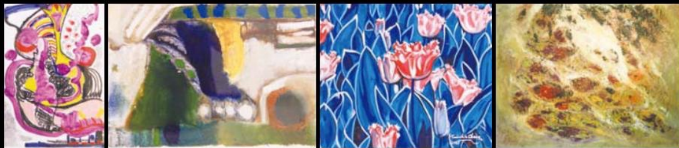
▲ 形象派聯展畫作中，豐富的色彩與天馬行空的構圖呈現出自由、活潑的氣息。

日本形象派美術協會是日本藝術家福山進老師於1952年所創，感念他熱愛臺灣，他的門生與故舊遂於1996年成立臺灣支部；協會成員遍及日本關東、臺灣、美國，歡迎對美術有興趣、認同形象派的同好加入，這也是協會推廣美術的宗旨。