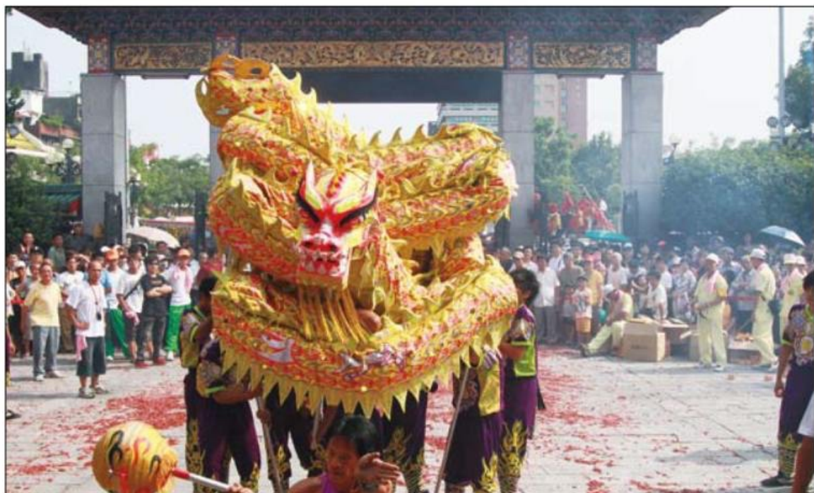
▲ 在傳統文化中，龍是吉祥的瑞獸，廟會的陣頭演出裡也少不了精采的舞龍。

肖來決定，後天的積德與修善，才是最根本的命運決勝關鍵。地上的人們盼望著龍子龍女，而龍自己的孩子又是如何？