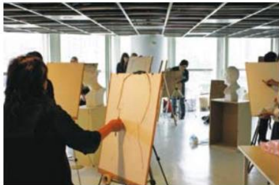
▲ 日本形象派聯展現場素描作畫情形

誠然「藝術即生活」、「藝術即修行」，經過長時間有恆地學習，一幅幅的作品都有一個故事、都是生活禪、都有他們的妙智慧，值得您來細細品嚐，追求心靈的享受，豐富您的生活。