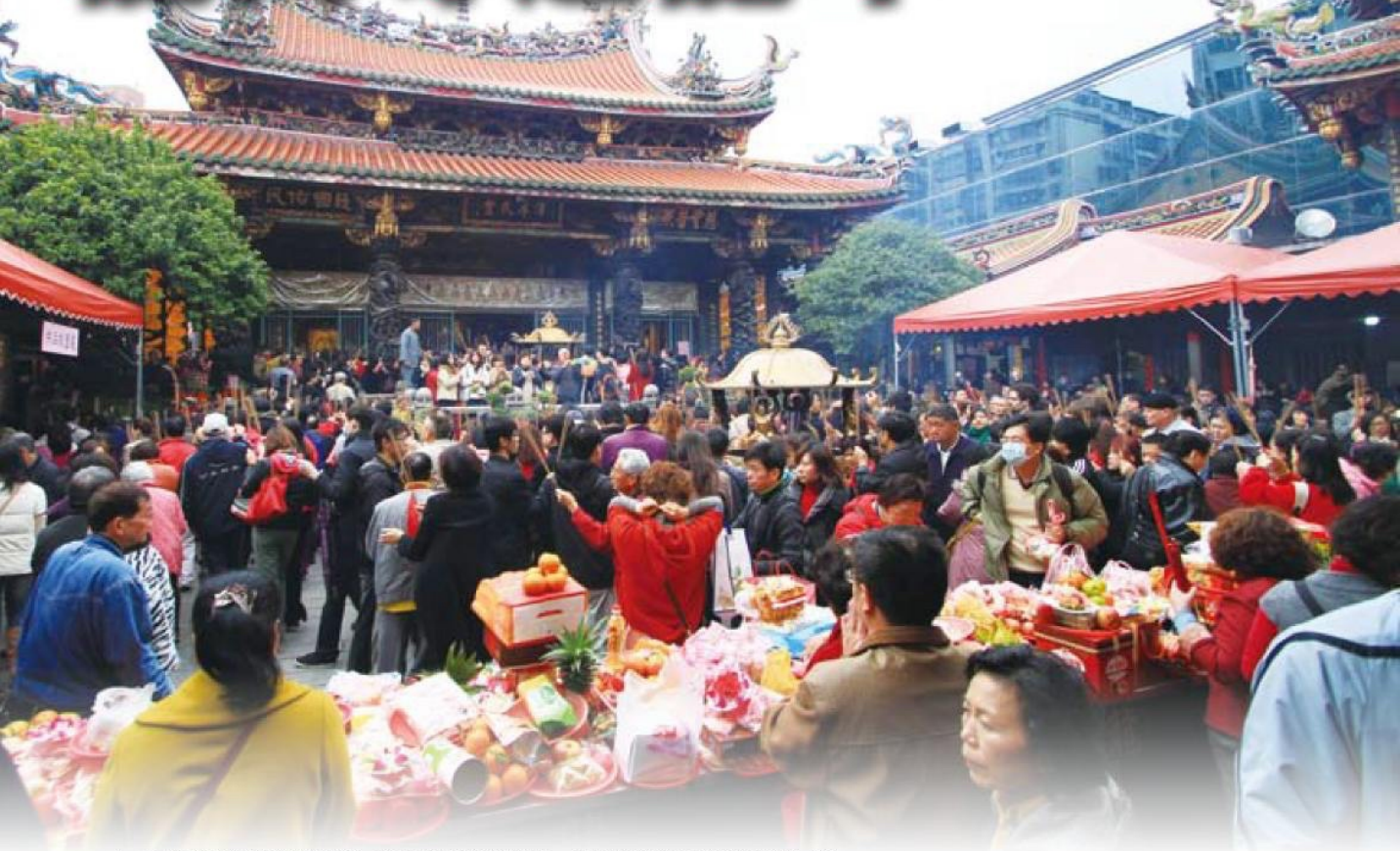
▲ 正殿前不但擠滿了人群，桌上也擺滿了供品，呈現出過年時節的熱鬧氣氛。