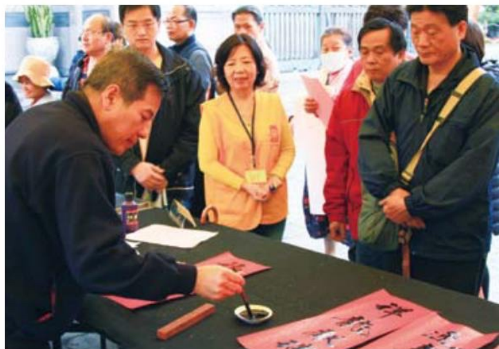
▲ 看到老師龍飛鳳舞的字體寫下的春聯，漫長的排隊等待都值得了。

下著細雨的假日早晨，龍山寺三川殿前廣場早已聚滿工作人員，為了一年一度的贈送春聯活動各自奔波。桌上早已擺好書法用品，一疊疊春聯用紙與遮雨棚相映出的紅色，暗示新年即將到來的喜氣，進廟參拜的遊客也迫不及待詢問，如何領取春聯，未料雨勢越來越大，工作人員不得不冒著大雨為發送紅紙處覆上遮雨的塑膠布，待一切準備妥當、書法老師也就定位，拿著紅紙的民眾早已自動排出一條條的人龍。為考慮到無暇等候墨跡風乾的信眾，我們也準備了現成的春聯，讓人人都能收到這份年前的小禮。假日時的龍山寺，除了