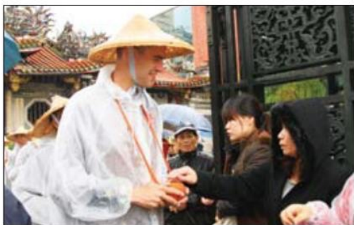
▲ 追隨佛法不分種族國籍，在眾多行腳僧中，這位擁有西方面孔的法師引起不少民眾的好奇。