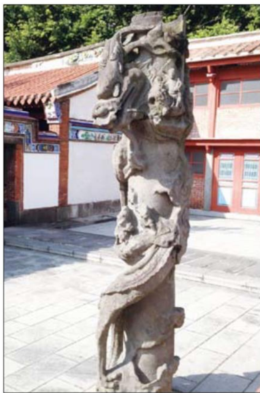
▲ 艋舺清水巖祖師廟後廣場上的龍柱，雖在日照雨淋下略有磨損，卻更見歷史歲月的痕跡。

來、碩果僅存、頭上尾下的昇龍柱為特例，其中一對，即位於艋舺清水巖祖師廟的廟後廣場。走到祖師廟後，這對昇龍柱在沒有任何廟宇建築的對照下，顯得格外突出，這對龍柱於清同治十年(西元1870年)由觀音石刻成，隨著年歲的累積，已有些許磨損，除了獨特的頭上尾下，另襯著八仙人物的雕刻，在空曠的廟埕靜靜地立著，來到艋舺祖師廟參拜後，別忘了到後面的廣場去欣賞這對難得的昇龍柱，其他兩座清代時期的昇龍柱則分別位於淡水關渡宮及北埔慈天宮。