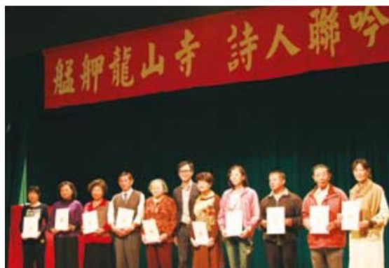
▲ 得獎詩人上臺領取獎狀並一同合影留念，看來得獎的女詩人不在少數呢。