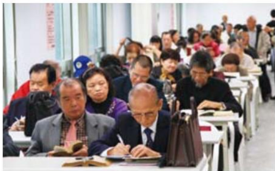
▲ 題目公佈後，有人即刻振筆疾書、有人則陷入沉思，場上風景各有不同。

因為適逢建國百年，各界皆舉辦相關慶祝活動，此次聯吟大會也邀請東北六縣市的詩社共襄盛舉，故又名「慶百歲 東北六縣市詩人聯吟大會」。一早的報到處早已充滿熱鬧親切的招呼聲，有些詩人正是藉這「一期一會」，能夠面對面彼此交流鑽研詩詞的心得與新的