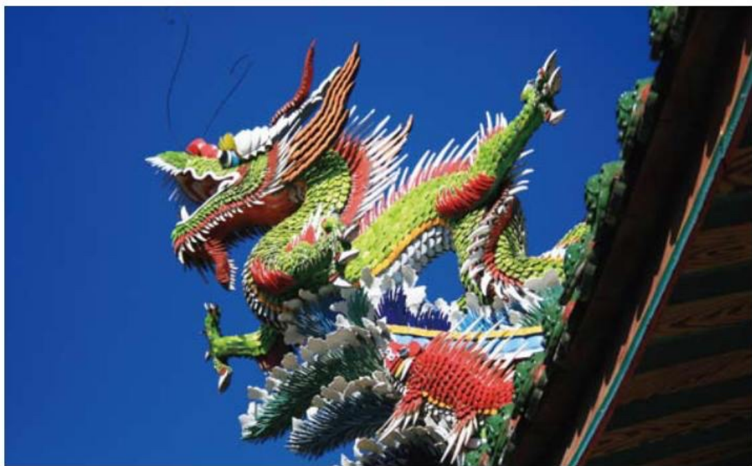
▲ 雖然龍是傳說中的生物，但在寺廟中所看到的龍幾乎都大同小異。圖為艋舺龍山寺鐘樓龍形剪黏。