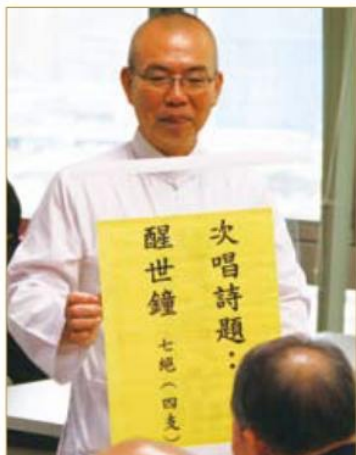
▲ 頒布此回次唱題目【醒世鐘】，在歡慶建國百年時，藉由詩人之眼所見，期望有醒世詩作，敲響塵世中的迷惑之心。

充滿古典雅緻氣息的詩人聯吟大會，在龍山寺板橋文化廣場舉辦已經進入第三屆，每年都能見到許多詩壇的先進同輩來到這