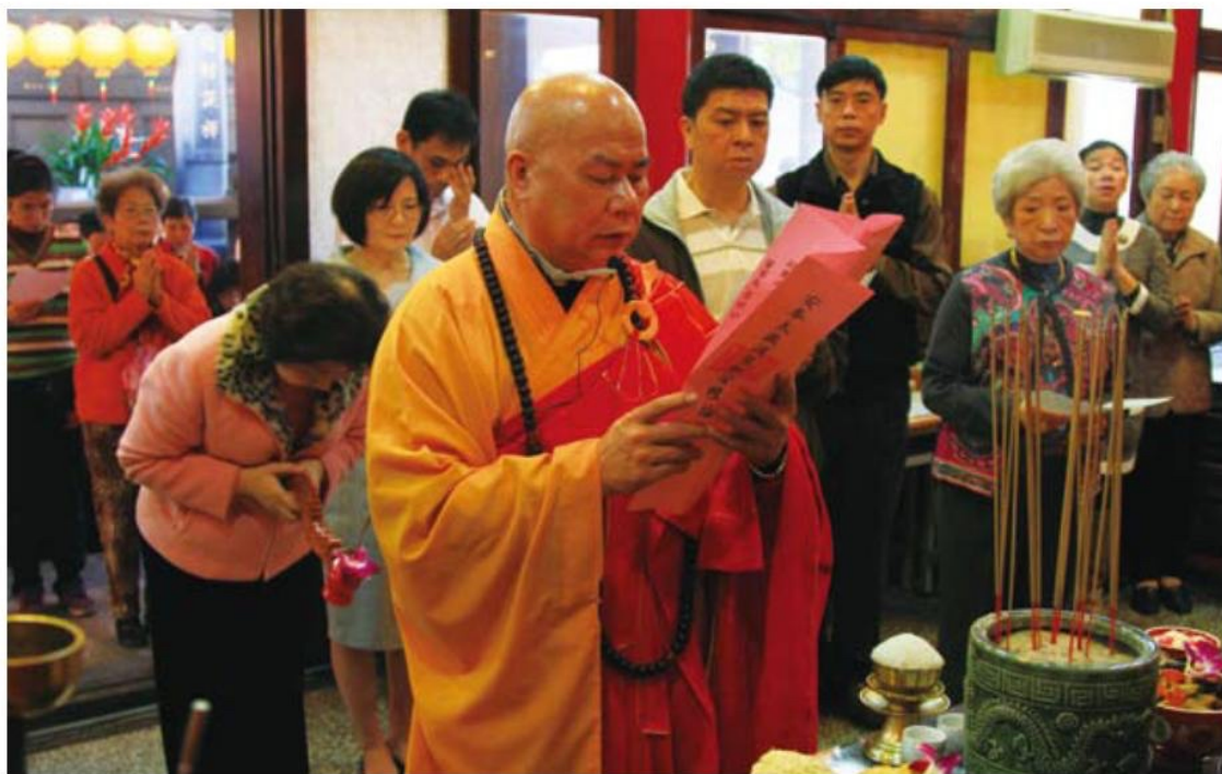
▲ 太歲廳裡，師父正恭讀安奉太歲消災祈安植福疏文，祈求太歲星君保佑新的一年裡，眾人出入平安，事事順利。

鮮花水果等供品，尤其是象徵平安的蘋果、代表吉利的橘子，更是隨處可見，大家都希望在新年的第一天祈求好預兆；上午十一時，正殿內的新春團拜，讓龍山寺董監事成員與祭祀團體成員再度齊聚一堂，互道恭喜，從大年初一到大年初三，龍山寺每日舉行拜千佛儀式，透過禮誦千佛洪名寶懺，能清淨心靈，讓新的一年法喜自在。