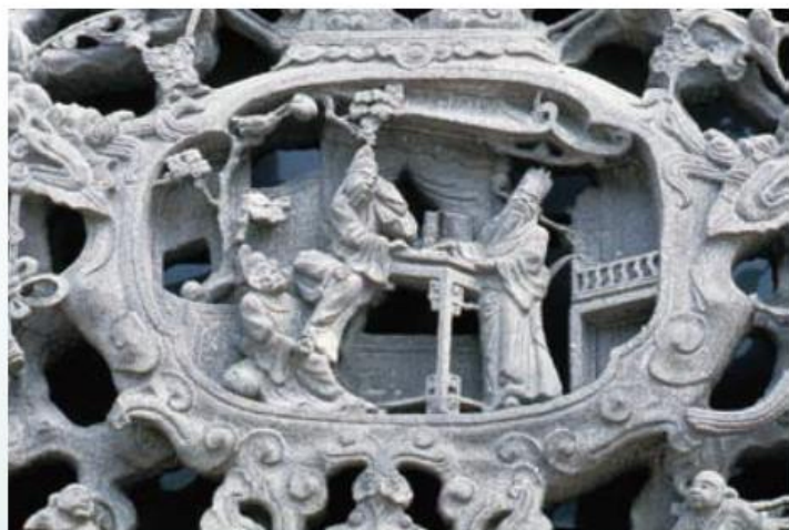
▲ 高力士、李白、楊國忠 (1990年攝)