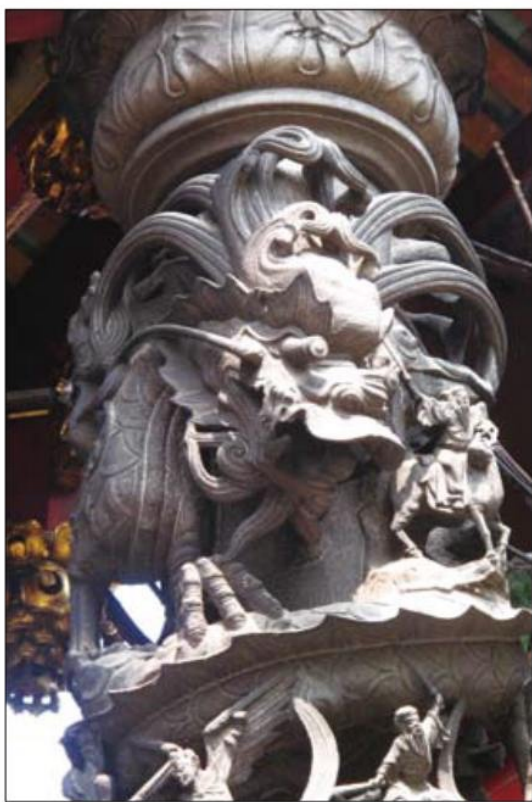
▲ 位於龍山寺正殿前的石雕龍鳳柱，輪廓鮮明，造型威武。