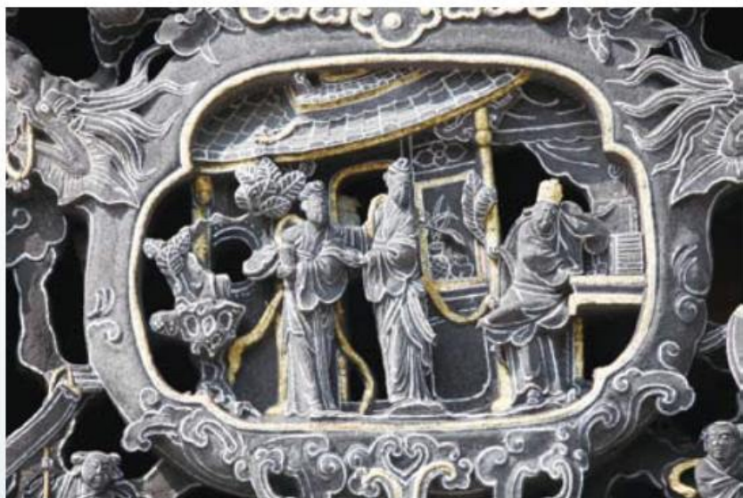
▲ 爐裡乾坤「送銀燈」人物窗