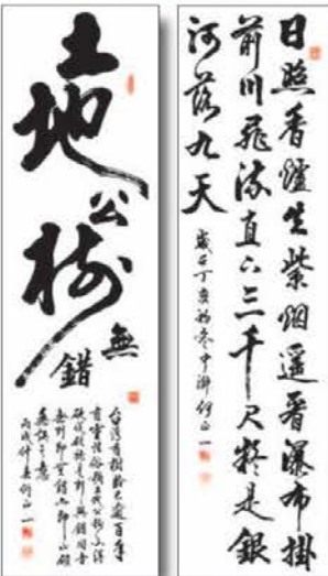
▲何正一老師書法作品

書法不僅是一門藝術，也是生活中的一種休閒消遣；學得一手好字饒贈親友，增進人際關係、廣結善緣，還能在書寫中修心養性，豐富人生。（本文作者為中華民國書學會會長及本廣場書法課程講師）