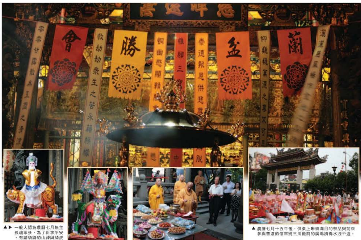
▲一般人認為農曆七月無主孤魂眾多，為了祈求平安，有請騎獅的山神與騎虎的土地公共同坐鎮約束。

▲董事長兼發行人：黃啟山 ▲發行所：財團法人台北市延平郡龍山寺 ▲地址：台北市廣州街211號 ▲電話：(02)2302-5162 ▲網址：http://www.lungshan.org.tw ▲編輯部：(02)8252-0103 ext.506 ▲傳真：(02)2257-7790 ▲臺灣郵政台北雜字第1276號執照登記為雜誌交寄 ▲設計承印：致生設計印刷有限公司