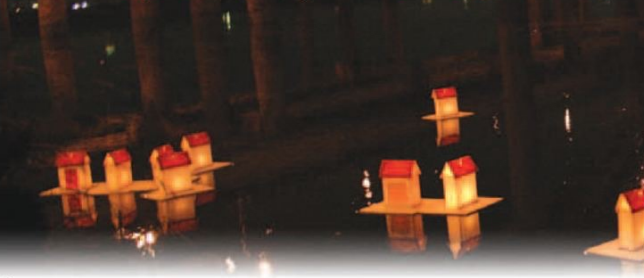
◀包括龍山寺在內的十二個單位所製作的水燈在信眾護送下順利施放入淡水河中，在民間信仰中認為水燈漂得越快、越遠，象徵運勢越發達。

無論在佛教或是道教，農曆七月都是一個重要的月份，農曆七月十五日為佛家所稱的「盂蘭盆節」，也就是道教所稱的「中元節」。盂蘭盆節典故出自「目連救母」，佛陀弟子目連，因母親在世時作惡造業，死後墮入地獄成為餓鬼受苦，目連不忍見母親挨餓便帶著食物到地獄給母親吃，但食物一入口隨即化為火焰；目連只好求助於佛陀，佛陀告訴目連，在七月十五日以盆子裝百味五果，用來供養僧人，藉這樣的功德，使母親從地獄得到解脫。後人則效法目連救母的方法，在每年的七月十五日舉辦普渡法會來超渡亡人，為盂蘭盆節的由來。