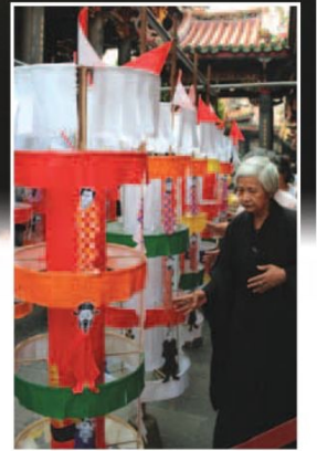
▲「起薦」是龍山寺盂蘭盆節的活動之一，民眾一面繞著一排排的車藏柱行走，一面轉動藏柱，有接引亡魂升天的意思。