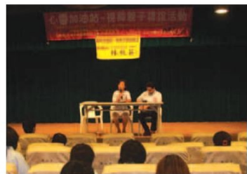
▲視障親子聯誼活動

到了早上八時三十分，報到與接待人員寒暄的問候聲音，早已充滿了文化廣場七樓的大廳。