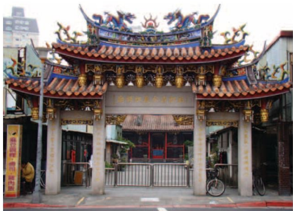
▲ 位在大馬路旁的牌樓。

位在康定路與長沙路交叉口的清水祖師廟，是萬華地區著名的古蹟和信仰中心，雖然祖師廟就在車水馬龍的大路旁，走進牌樓，廟前廣場盡頭的祖師廟卻格外寧靜，古色古香的廟宇像是另一個時空，不由得讓我想到陶淵明的詩句：「結廬在人境，而無車馬喧，問君何能爾？心遠地自偏」的意境。