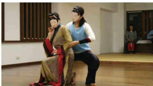
▲江之翠劇團「一紙相思」排練一景。

碼，尚有許多才子佳人悲歡離合的經典戲曲，透過許多不願傳統藝術失傳的表演團體，世世代代的傳唱延續下去。(文字、攝影/編輯部，感謝江之翠劇團協助拍攝)