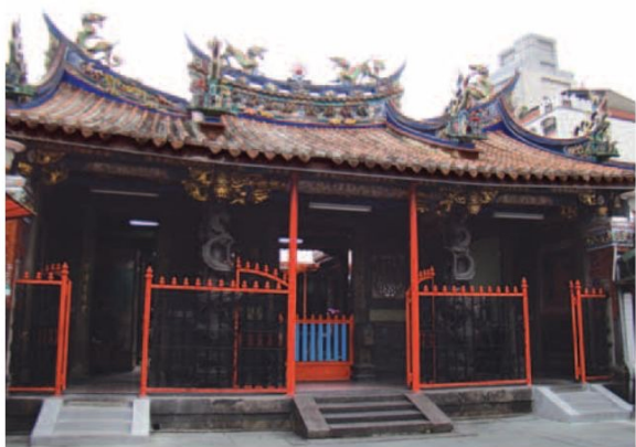
▲ 古色古香的艋舺清水巖祖師廟，座落在馬路及民宅之中，顯得特別寧靜莊嚴。

踏著充滿古老氣味的台階走進祖師廟，看到供桌上三尊黑色的清水祖師爺神像，嘴角忍不住泛起微笑。祖師爺神像和一般神像不同，有著特別大的頭和相對來說顯得較小的身軀，黑色的面容帶著開心的微笑，莊嚴又親切可愛。