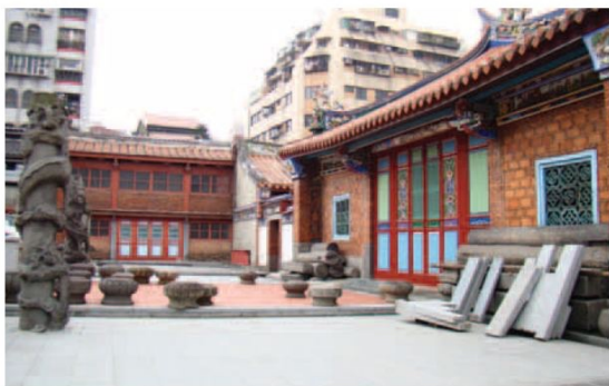
▲ 廟後方的空地原本是祖師廟後殿，燒毀後部分變為停車場，部分則堆放了後殿遺留的石柱。