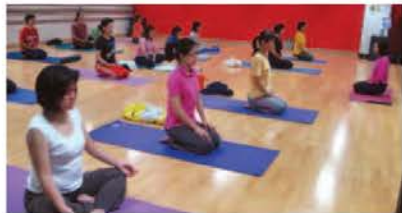
▲ 本廣場瑜珈教室上課情形。

有些朋友也常會問到：你教的是什麼派別的瑜珈？我以為派別並不重要，重要的是：當你練完瑜珈時你身心靈的感覺如何呢？練完了應該覺得全身舒暢，心情放鬆、平靜，整個人覺得好舒服，這就是適合你的瑜珈了。（本文作者為資深瑜珈老師/暨本廣場課程講師）