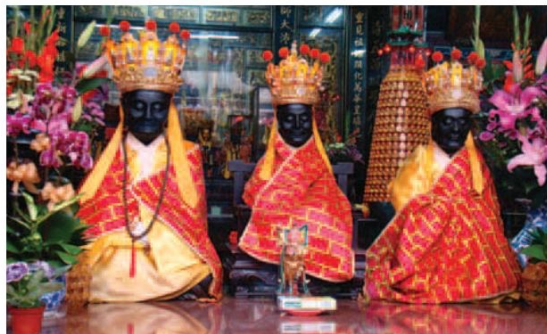
▲ 清水祖師爺的塑像面容莊嚴又親切，模樣和一般神像很不同。

從大殿走進左方偏門，經過古井再往後走，才發現祖師廟竟只有大殿，後方則是一片空地 and 停車場，志工小姐說，原本祖師廟建於1787年，經過幾次戰火的摧殘，目前看到的祖師廟是於1867年所重建；當時原本共有三殿，後殿由於在日據時代，日本政府先於1896年在此設立國語學校附屬第二學校(今臺北市立師範學院)、後於1922年在此設立臺北州立臺北第二中學校(今成功高中)，從此失修，並於1940年倒毀，加上民國六十年為了拓寬長沙街，祖師廟的右護室被局部拆除，成了現在空曠待興的模樣。