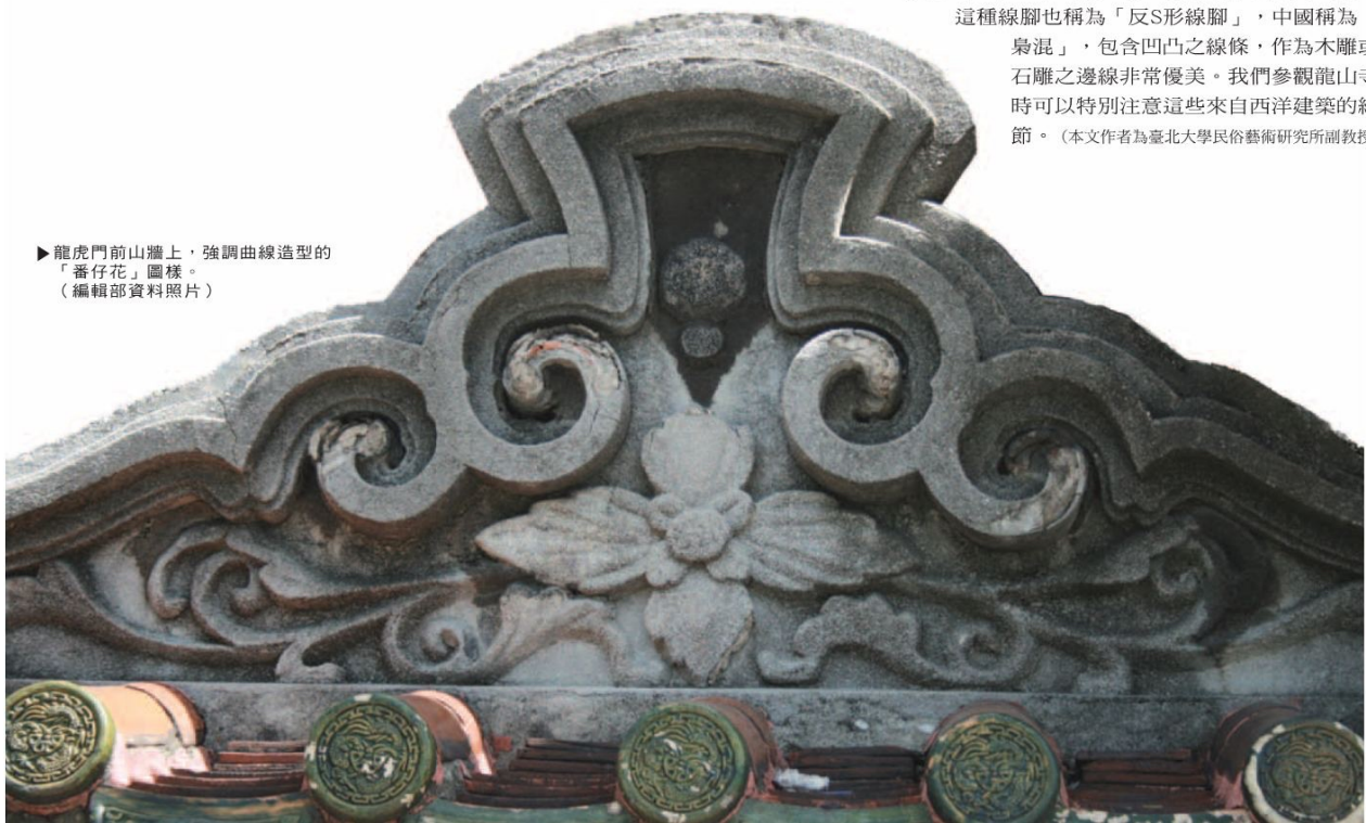
▶龍虎門前山牆上，強調曲線造型的「番仔花」圖樣。

最後，龍山寺正殿石堵上的線腳也帶有濃厚的西洋風格。將正殿石牆分為上、中、下三段，每一段皆有許多凹凸的框，這種線腳也稱為「反S形線腳」，中國稱為「梟混」，包含凹凸之線條，作為木雕或石雕之邊線非常優美。我們參觀龍山寺時可以特別注意這些來自西洋建築的細節。(本文作者為臺北大學民俗藝術研究所副教授)