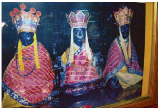
▲ 正殿內擺放了傳說中的「落鼻祖師」照片(正中)，祖師爺神像的鼻子有多次黏回的痕跡。

如今在舊時通往後殿的空地上，還可以看到許多屬於後殿的石柱，雕刻精美且充滿古意，幸好祖師廟已計畫向政府提出重修申請，期待未來後殿重建後，能重新被利用，再度展現風華。