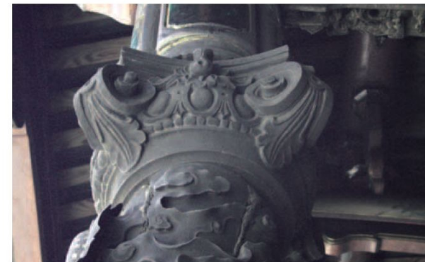
▲龍山寺三川殿前，採以西洋式雕刻的柱頭。

在石柱構造方面，有三點係得自西洋建築之影響，東西龍虎門做雙心圓拱，左右門柱出現「柱頭」與「腰線」，這是西洋建築常用的技巧。其次大殿的花瓶形欄杆也屬於西式作法，前述的柱頭，包括前殿後面龍柱及花鳥柱上皆使用西洋式柱頭，花鳥柱上有「石工蔣細來製造」落款。