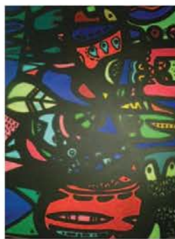
◀ 即使在安靜的世界裡，仍能繽紛的顏色，譜出聽不見卻精彩熱鬧的作品。

力度；雖然聽不見人間的悅耳曲調，卻能用眼睛安靜從容的觀看，記錄花花世界裡容易被忽略的細微末節；創作者用靈魂去擁抱這個世界，將他們所看見的美好一面，用各種方式、各式媒材呈現在大眾的眼前，他們在安靜的世界裡默默地創作，運用最細膩的感官，用藝術表達他們想說的話，用每次的刻劃來低語或吶喊，邀請我們一起翱翔藝術的天地。（編輯部）