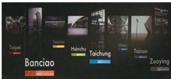
▲ 旅行也是一種出走，在旅途中按下快門，捕捉每一個轉身即忘的風景。