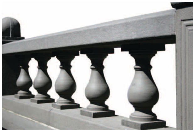
▲正殿的花瓶式欄杆帶有中西融合的趣味。

西洋古典建築從希臘到羅馬時期，發展出一系列的柱式，柱頭的形式與柱子的高度有一定的比例關係。一般常用的有較粗大的托斯卡尼式與多利斯式，較細長的有愛奧尼克式、歌林斯式以及混合式等三種。臺灣在清末的洋樓，例如英國領事館或馬偕傳教士所建的很少用到古典柱式。直到二十世紀初期，日本建築師在臺灣所建的「後文藝復興式」，如總督官邸、臺北自來水唧筒室(今自來水博物館)、總督府(今總統府)及臺灣博物館等皆大量出現西洋柱式。而臺灣寺廟也受到這股風潮影響，在龍柱上加上一個希臘柱頭，觚 龍山寺在1919年的改築，可能是第一波出現西洋柱頭之例。