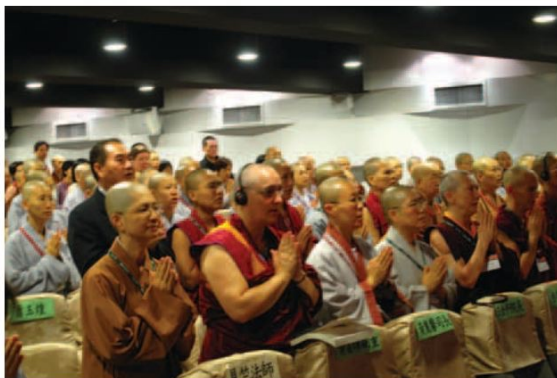
▲來自世界各地的四眾弟子共同參與此次國際研討會，彼此交流教育心得與理念。