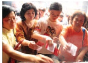
►無論是學生或是家長，帶著准考證與神來之筆繞著文昌帝君前的香爐薰香，祈求金榜題名。

領取神來之筆並繞香爐一周，希望領取神來之筆的考生們都能在準備考試時專心凝神、在考場應試時冷靜沉著、發揮實力，獲得佳績。