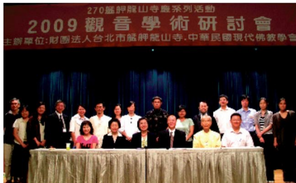
▲2009觀音學術研討會與會貴賓及學者合影留念。

表；與移民墾拓史發展出的北臺灣龍山寺法脈的觀音信仰組織發展、每年農曆二、六、九月固定於鷲峯龍山寺舉辦的觀音法會重要科儀分析，以及龍山寺莊嚴神聖、精緻巧妙的正殿建築欣賞。豐富的議題與精闢入裡的解說，讓與會者在為期兩天的學術研討會中，吸收有關觀世音菩薩更多、更深廣的知識，也期望藉由這次的觀音學術研討會，感懷並承襲觀世音菩薩的慈悲願力，使人心淨化，社會祥和安定。（編輯部）