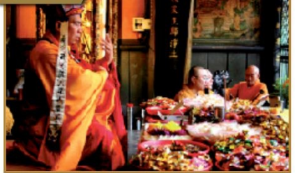
▲除了每年在三川殿前廣場堆滿祭品，龍山寺也在盂蘭盆節這天舉辦鐵口施食法會。桌上擺滿糖果、鮮花、錢幣、素菜，在法師的誦經祈福下，普施給天下無主的孤魂，期盼長久以來缺少祭拜的他們，在這一天的能夠吃得飽足。（編輯部資料照片）