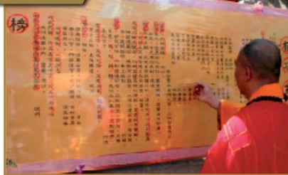
▲農曆七月十五日，也就是盂蘭盆節當天，在龍山寺廣場架起祈福的榜文，法師手執硃砂筆連連在上畫記並誦念祈福榜文，昭告四方盂蘭盆節的到來，接著就是熱鬧的普渡大典了。