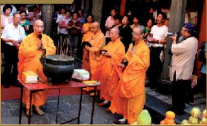
▲在北臺灣開發初期，來自福建沿海的泉州人和漳州人，在艋舺為了土地侵占等糾紛，時有流血械鬥，當時泉州人將戰死罹難者的血衣，一同埋葬在龍山寺內一株樹蘭花底下作為紀念，每年農曆七月十三日在太歲廳前舉行的「拜樹蘭花腳」也成了龍山寺別具特色的祭祀儀式。