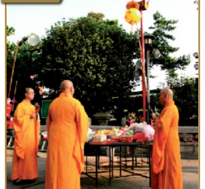
▲農曆七月三十日，法師們聚於龍山寺三川殿廣場的燈篙下，誦經祈求盂蘭盆節的所有活動在這最後一天能圓滿順利。接著將燈篙降下，取走燈篙上的燈籠，盂蘭盆節這個好兄弟們的假期就在這裡畫下了句點。