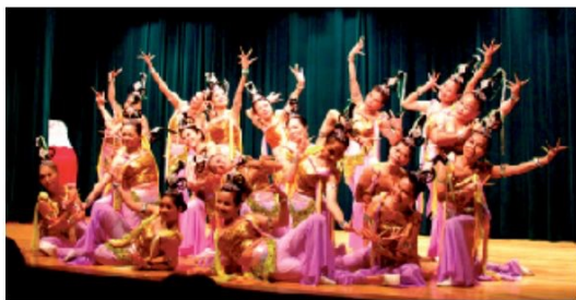
▲身段輕盈的敦煌舞學員們彷彿天女下凡。

成果發表會一開場，由去年壓軸的梵唄班帶來「梵音組曲」揭開序幕，藉著莊嚴的唱誦，回向給在座的每一個人，讓身心都能得到淨化與祥和；緊接著在仙樂飄飄中，一群美麗的伎樂天女們，為在場來賓帶來曼妙優雅的敦煌舞；因為聽障奧運而受到矚目的手語、社團教室熱門的養生氣功與太極等班級自然也不能缺席；此外，今年還有新登場亮相的課程：融合了剛勁的太極招式與輕盈飄逸的摺扇舞姿，剛柔並存的太極扇表演，讓全場眼睛一亮；親子讀經班從後臺排演時就備受工作人員的