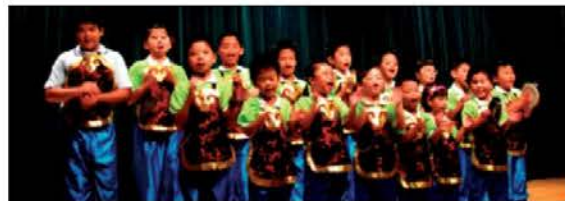
▲本廣場讀經班小朋友在成果展背誦「百孝經」，活潑可愛的演出博得全場熱烈掌聲。

只要家長和孩子一起讀經，多用心、多鼓勵，持之以恆，不輕易放棄，家中小寶貝絕對會是個知書達禮的好孩子！（本文作者為本廣場親子讀經班講師）