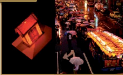
▲放水燈一向是盂蘭盆節的重頭戲，農曆七月十四日的傍晚，兩車巨大的水燈排與信眾們，自龍山寺出發，繞行拜訪萬華區的各著名宮廟，一同護送包括龍山寺及其相關團體共十二座水燈，最後至河邊施放。今年放水燈不巧遇上猛烈的暴雨，虔誠的信眾仍撐著傘亦步亦趨的跟隨著水燈排。