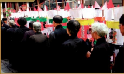
▲「牽水轆」是一種超渡意外往生者的儀式，轆柱上貼寫著往生者資料的紅紙（見血光之災）和白紙，當信眾們繞行轆柱時，一面轉動著轆柱，象徵將溺水或是難產的亡魂自陰間牽引，從轆柱最下方的牛頭馬面、黑白無常，經過文武判官與地藏菩薩，最後上抵天界。（編輯部資料照片）