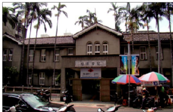
▲位在廣州街上的舊仁濟醫院，古樸的建築造型和街前的汽機車與攤販，形成時空交錯的對比。