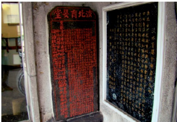
▲舊仁濟醫院的大門旁，牆壁上矗立著一百多年歷史的淡北育嬰堂碑，右手邊則是後來設立的淡北育嬰堂碑沿革記略，紀錄了此碑的歷史。