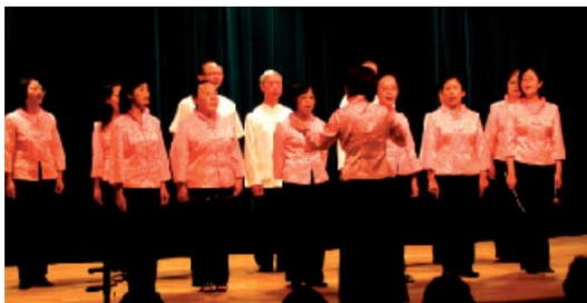
▲以臺語吟唱的詩詞賞析班，讓人發思古之幽情。