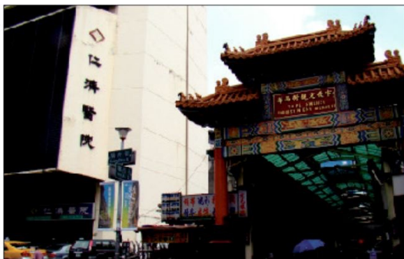
▲位在舊仁濟醫院對面、華西街牌樓旁的仁濟醫院，是萬華地區主要的醫療機構之一。

再回到廣州街上，身處於三棟仁濟醫院之間，心思回到一百多年前的艋舺，當時此區已經相當繁榮，彷彿可以看到人來人往、繁榮街景的背後，有許多棄嬰老病弱者隱藏在社會的角落，不論是育嬰堂、養濟堂直到現在的仁濟院，一百多年來即使名稱變更，扮演慈善照顧弱者的角色不變，擁有百年歷史的育嬰堂碑提醒著人們：就算社會不斷進步，依舊是處處有溫情。我們是否也該不吝付出自己的力量，成為付出愛心的一份子？（文·攝影 高則容）