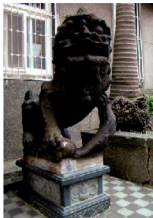
◀門口除了育嬰堂碑，最引人注意的就是一對石獅，這對石獅的歷史可能比仁濟醫院的建築物本身還古老，但來源已經不可考。