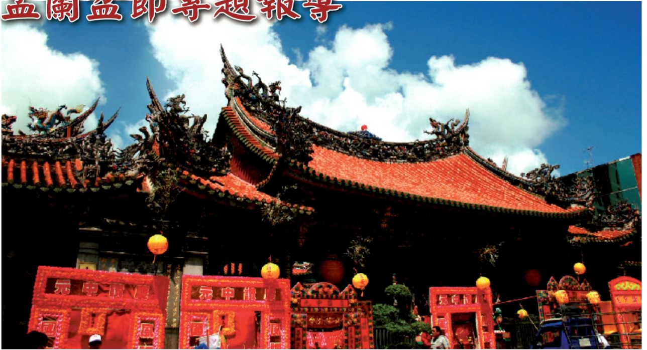
▲中元普渡當天，藍天白雲與龍山寺三川殿廣場前的紅屋瓦及普渡壇相互襯映，令人留下深刻的記憶。（編輯部資料照片）