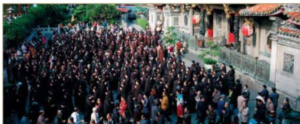
▲國曆元旦的早晨，在溫暖的陽光照耀下，龍山寺山川殿前廣場的信徒虔誠的繞佛，在莊嚴的佛號中，祈求消除業障，增長福慧。

在阿彌陀經、無量壽經、觀無量壽佛經等佛經裡，詳細記載了法藏比丘發願成就的過程，以及極樂世界種種殊勝莊嚴的境界，並告訴我們如何修行、如何發願往生的種種條件，所以，在每年農曆十一月十七日，也就是阿彌陀佛的誕辰日，往前推算七日開始，許多寺廟，尤其是修淨土法門的道場都會舉辦念佛七永日的法會，也就是俗稱「打佛七」(