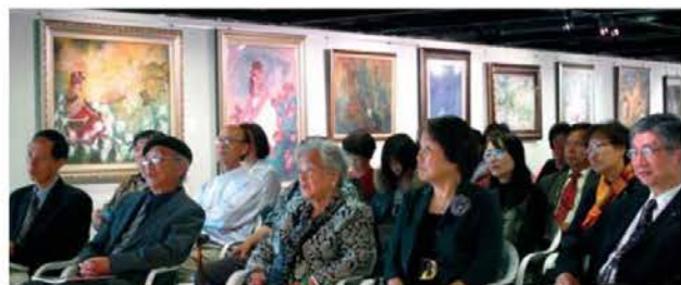
▲綠水賞開幕典禮上，聚集了許多貴賓，不乏當代藝壇的大師，與廣場的畫作相映生輝。

以膠彩畫為主，已經有多年歷史的綠水畫會，是由一群知名畫家如陳進、林玉山、郭同發起成立，畫會成員大多為位於北部的膠彩畫家，主要目的是期使膠彩畫能在北臺灣紮根並且成長茁壯。除了平日鼓勵膠彩畫的學習創作外，綠水畫會每年都會舉辦作品展，藉以相互切磋研習作畫技巧，去年12月12日，綠水畫會與龍山寺板橋文化廣場在廣場五樓的展覽館，舉辦「臺北市膠彩畫綠水畫會第十九屆會員及第五屆綠水賞徵件展」，並舉行綠水賞頒獎典禮。這一次一共收集到56件畫作，每件畫作無論在題材或是表現上都有相當高的水準。當天下午會場湧入許多畫會成員及家屬，不管是一般會員創作，或是得獎入選的作品，都吸