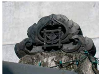
▲法華寺外牆上的黑瓦當，上頭有著代表日蓮宗的蓮花圖案。

◀日據時代，信徒常會一步一拜或三步一拜的來回山門與正殿間一百次，藉以淨化自己的心靈，參道右手邊的百度就當作計數器。