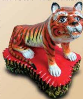
▲這是位於龍山寺圓通寶殿中，十八羅漢神龕裡伏虎羅漢所降伏的老虎塑像，被降伏的老虎少了兇猛的殺氣，反而增了些可愛的趣味。

我們在今年是否能夠像老虎一樣勇猛、激進？經濟能否好轉？就有賴全民團結努力，共同締造一個福氣吉祥的大好年，就看「福虎生威」吧！