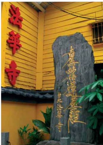
▲日蓮宗尊崇「法華經」，山門旁的石碑刻上「南無妙法蓮華經」。

在這麼一個充滿臺灣味的萬華地區，法華寺靜靜的佇立在喧囂都市的一角，似乎在提醒著臺灣有這麼一段受日本統治的歲月，並期待有緣人來尋幽訪勝了。