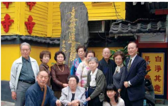
▲每年三月，來自日蓮宗的僧侶及信眾總會組團來到法華寺舉行追思慰靈法會。