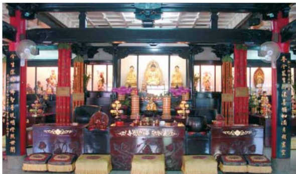
▲莊嚴樸實的大殿內，閃亮的佛祖金身，讓心情也跟著收斂安靜。