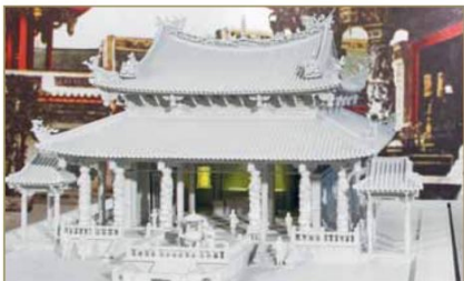
▲模型以壓克力製成，以特殊上漆技法呈現木材的質感與顏色，屋脊上的燕尾、瓦當、寶塔作工精細，觀眾得以近距離欣賞龍山寺的寺廟之美。正殿主佛觀世音菩薩以等比例縮小製作，以LED光源塑造透視效果，佛像上的衣服摺痕栩栩如生。

靜靜坐落在臺北城西南角已270年的龍山寺，是臺北人信仰的重心，也是外地人來臺必遊的觀光勝地，然而大多數的人，只知有龍山寺，卻從來不曾真正認識龍山寺，這座現代廟宇建築藝術的寶庫，在寺內虔誠祈禱時