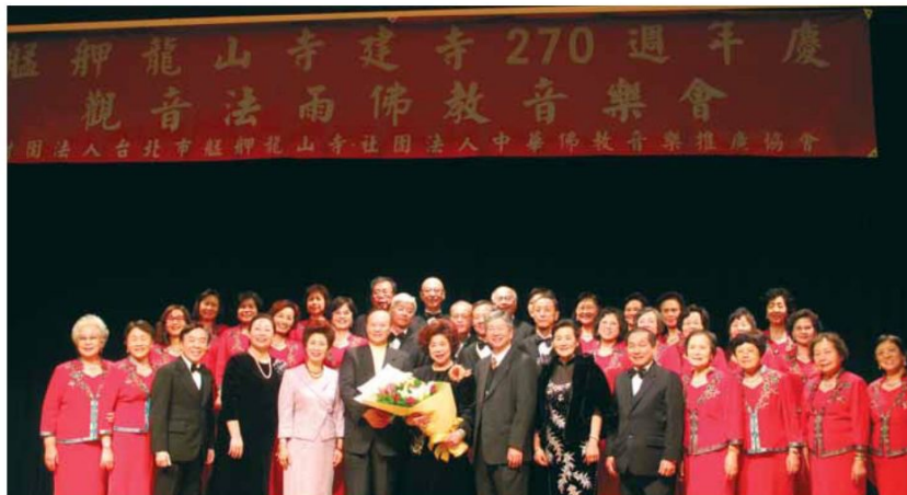
▲演出的合唱團與本寺副董事長及文化廣場執行長合影留念。