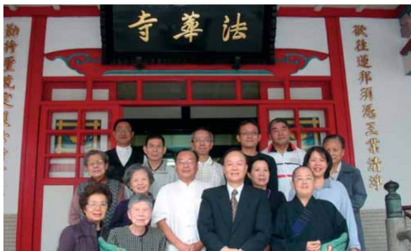
▲法華寺全體董監事會合影。