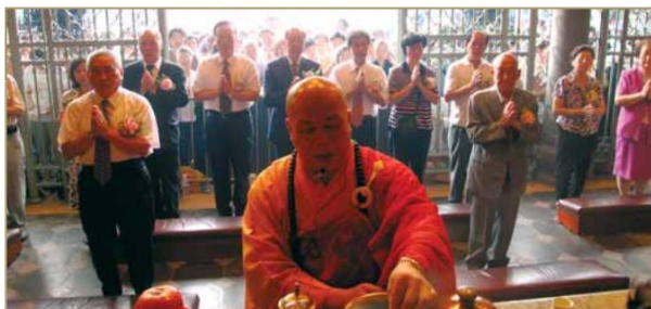
▲觀世音出家紀念典禮上，由法師領眾依序向菩薩供香。

經由法會唱誦普門品，讓我們更瞭解觀世音菩薩的慈悲悲願，以三十二應化身十四無畏、尋聲救苦來度化眾生。