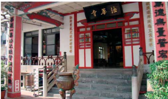
▲法華寺的正殿外觀，建築充滿濃厚的日式風格。

◀日據時代，信徒常會一步一拜或三步一拜的來回山門與正殿間一百次，藉以淨化自己的心靈，參道右手邊的百度就當作計數器。