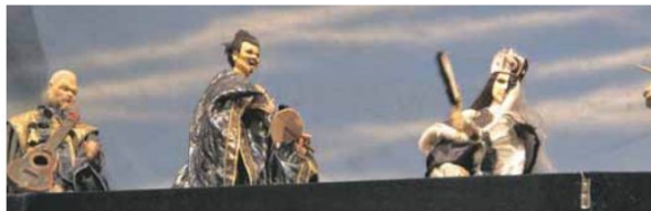
▲這三尊戲偶由左而右分別是史豔文的戰友怪老子、劉三與宿敵黑白郎君，想必勾起了不少人的兒時回憶。

雖然布袋戲演出時，活靈活現，躍然掌上的戲偶如此吸引人，然而「三分前場、七分後場」，沒有後場音樂鑼鼓的襯托與營造氣氛，故事的趣味也就減少許多，而幕後音樂的體系和轉變也隨著時代遷徙而漸成三大主流。就音樂的轉變來看，早期的布袋戲多為南管音樂系統與潮調，潮調又稱「道調」或是「師公調」，指的是流行在廣東潮州一帶的傳統民俗音樂，由於同屬閩南語流行的區域，因此福建漳州部分地區的戲曲或是布袋戲後場音樂也受到潮調的影響。早期以南管戲曲音樂為大宗的布袋戲，演出時細膩的動作、幽長婉約的唱腔，加上文雅的戲詞，使得當時的布袋戲演出，似乎只能侷限於某個階層的族群才懂得欣賞，然而這樣的限制，讓許多布袋戲團因此逐漸凋零，為了吸引更多觀眾求生存，布袋戲逐漸加入北管等其他地方音樂，這樣的演變也讓布袋戲的音樂結構變得豐富多元。