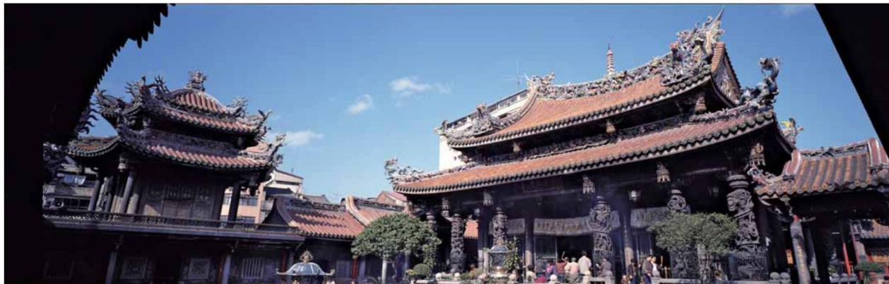
▲廟宇建築空間次序，配合祭祀的需要與視覺上的協調，表現出開闊寬廣及親切適中的建築美學尺度。

「 觚 龍山寺」一主祀觀世音菩薩，配祀天上聖母、文昌帝君、關聖帝君等。是臺灣最著名、歷史極悠久的佛寺，從清乾隆初年創建，迄今已有二百七十多年，尤其與老市區觚解之變遷息息相關，可以說龍山寺的歷史即是觚解史不可分割的一部分。其伴隨著臺北盆地之開拓與都市發展，一直都居於臺北發展史上重要的指標，且在臺灣眾多寺廟中，無論建築規模與雕琢、裝飾藝術之精美，皆名列前茅，足以代表臺灣古建築之典型。