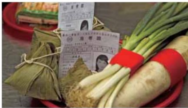
▲吃過神明祈福過的食物，帶上加持過的准考證，以平常心全力以赴，求取佳績。

提醒所有考生來文昌殿前參拜時，不要忘了文昌帝君右側供奉的大魁星君，傳說文昌帝君掌管人間祿籍，大魁星君主管考試，其腳下踩著的鯨魚，象徵著「獨占鰲頭」，因此希望一舉中第的考生們，記得也要向大魁星君說出自己的心願。（編輯部/張詠維）