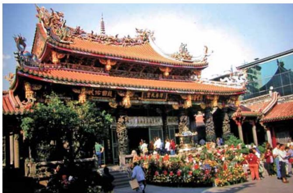
▲大殿屋頂為歇山重簷式，殿前有月臺伸出，四面走馬廊，共四十二根柱子構成。