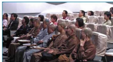
▲生與死是不分階層的人生重要課題，前來參加講座的除了一般民眾，也不乏出家師父。