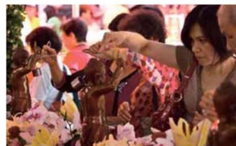
▲浴佛的花台設置於中殿御路前，三尊佛陀聖像 在百花環繞下，更顯莊嚴。

中殿前廣場上，虔誠祭祀的信徒，喝著浴佛水的婦人們，還有帶著小孫兒一起來禮佛的老奶奶，平和溫馨的氣氛像是裊裊輕煙，在寺裡飄散，數百年來，這屬於艋舺人的生活習慣，在觀音佛祖慈眉注視下，渡過了清代、日治，直到民國，而且還會繼續傳承下去。（編輯部/張詠維）