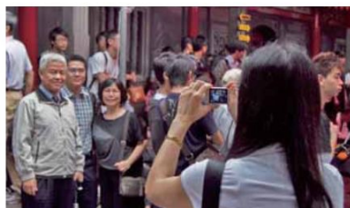
◀頒獎典禮開始前，與孩子們一同前來領獎的家人，於中殿廣場前開心的留影。