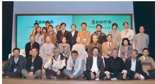
▲與會者在學術研討會後共同合影留念。