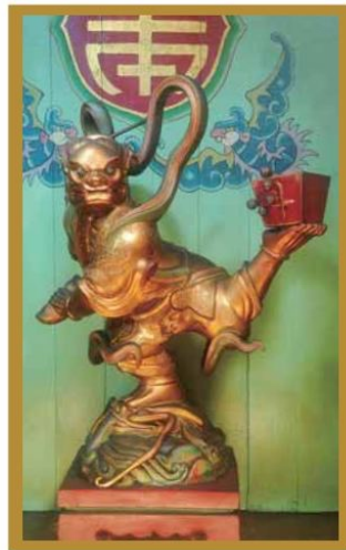
▲大魁星君

左側所供奉的紫陽夫子，其實就是南宋大名鼎鼎的學者朱熹。朱熹一生有許多著作，最廣為人知的應是他傾盡畢生心血所寫的「四書章句集注」，同時他也奠定了南宋以後科舉考試中，將四書五經等典籍列為